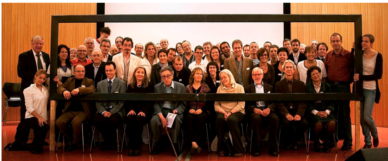
Photo prise lors du séminaire final – 8 septembre 2010 – HEP Lausanne, avec les partenaires européens et suisses, les participants actifs aux formations et les bénévoles pour ce 9e forum eCulture