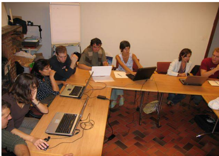
Image : workshop durant le forum du 26 Septembre à Crêt-Bérard , formation à l'usage d'un ePortfolio, avec les délégués des institutions suisses et européennes