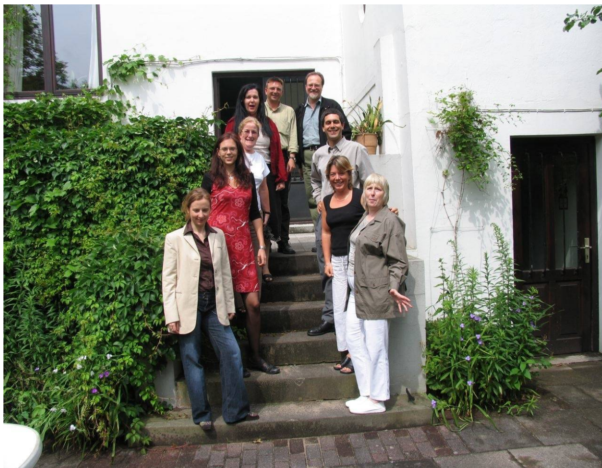
Image: les participants à la rencontre de coordination à Brême en Allemagne