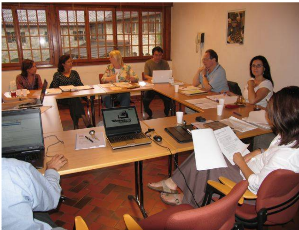
Photo: workshop durant le séminaire final en Suisse avec les participants invités de tous les pays, 26 Septembre à Crêt-Bérard